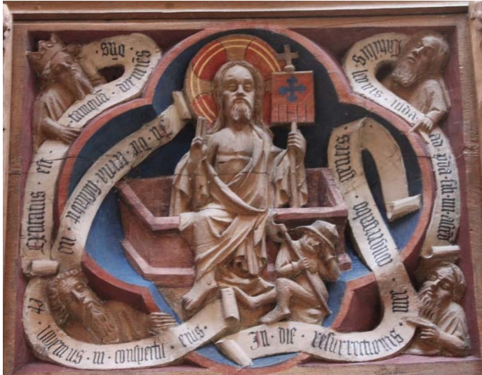
Gotisch houtsnijwerk koorbank Kathedraal van Roskilde (Denemarken)