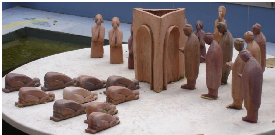
Nes Ammim, Israël - Joden, Christenen en Moslims naar één gebedshuis