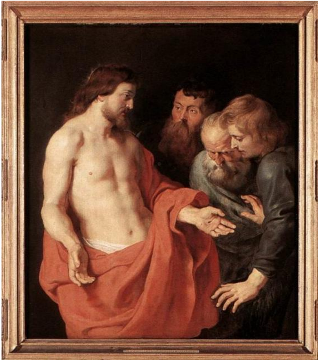
P.P. Rubens, (± 1614) Christus toont zijn wonden middenpaneel, Koninklijk Museum voor Schone Kunsten Antwerpen